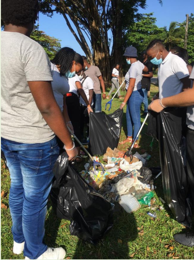
Nettoyage de l'Anse Châton